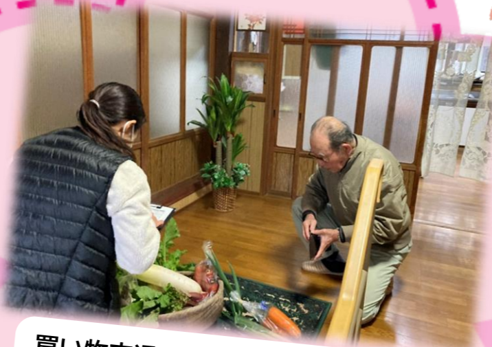
買い物交通への取組(竹野・中竹野地区) 地区で始めたふれあいマーケットの野菜を見守りを兼ねて配達する取組