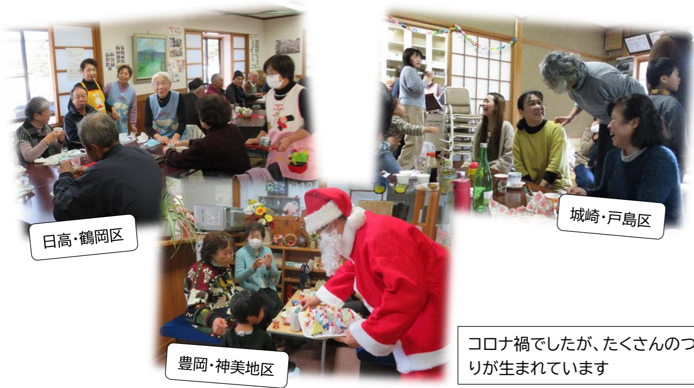
コロナ禍でしたが、たくさんのつながりが生まれています