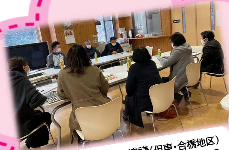
地域課題について協議(但東・合橋地区) 生活支援活動(高齢者への見守り訪問等)の取組について協議を行う