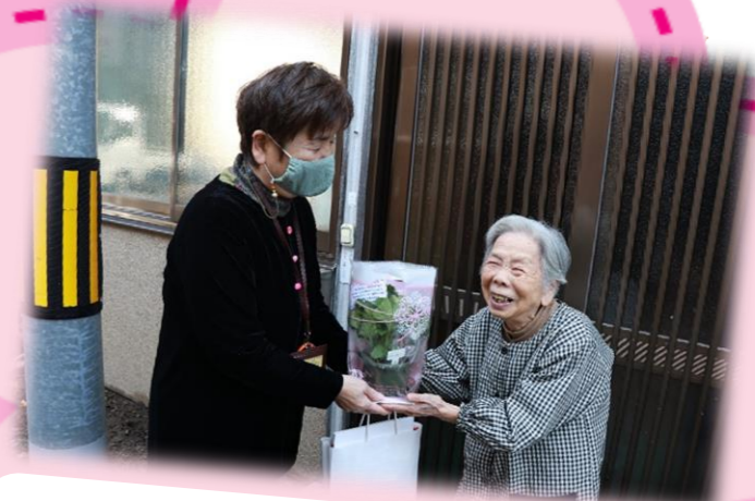
腐葉土から広がる地域の輪(城崎・城崎地区) 城崎中学生と腐葉土を使ったフラワーポットづくりから、フラワーポットを一人暮らし高齢者へ届ける取組

令和3年度も新型コロナウイルス感染症の影響によって、地域の支え合いやつながりが途切れるのではという状況の中でも、地域の皆さんの創意工夫した取組みが地域の支え合いを高めています。生活支援コーディネーターも地域住民の皆さん等と一緒に地域の課題に取り組んでいます！