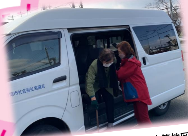
移動交通への取組(豊岡・中筋地区) 地区内の移動交通課題について、福祉車両を地区で活用した取組