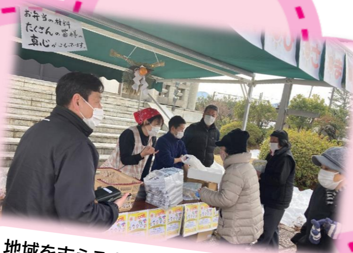
地域を支える食のつながり(出石・小坂地区) 「食」をつうじて地域の交流・支え合いの輪を絶やさぬようにする「おひさま食堂」の取組