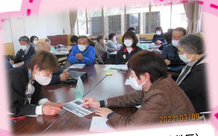
サロン世話役交流会(日高・日高地区) 地域でサロン活動を行う世話役の横のつながりづくりに向けた取組