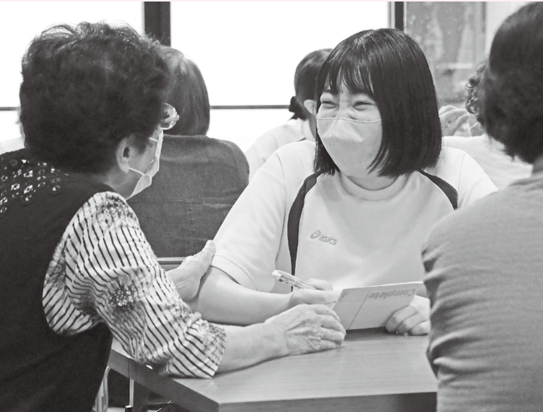
(左上) 学生とサロン参加者の短冊が仲良く並びました。(上中) 東構区サロン (上右) 国分寺区サロン (下) 江原区サロン どのサロンでも、和やかで笑い声の溢れる時間を過ごしました。