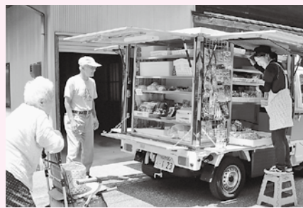
移動スーパー123 いちにさん 竹野地域内で、利用者の見守りを兼ねた移動販売を行っています。