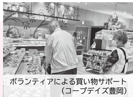
ボランティアによる買い物サポート (コープデイズ豊岡)

豊岡市では人口減少・少子高齢化などを背景に、スーパー・商店の減少、交通網の縮小化などが進んでいます。食料品・日用品などの買い物が自由にできない方が増える一方、そのような困りごとの解決に取り組む「買い物支援」が広がってきています。今回は、市内で広がる「買い物支援」についてご紹介します。