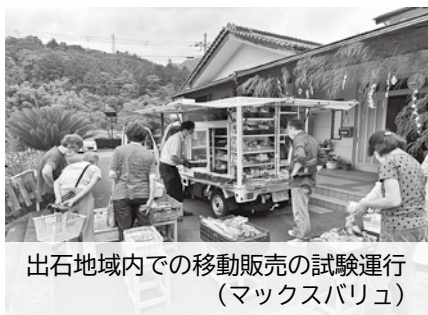
出石地域内での移動販売の試験運行 (マックスバリュ)