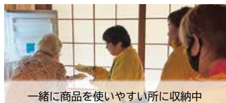
一緒に商品を使いやすい所に収納中

令和4年に「9th Factory」の協力を得て、豊岡地域でもスタート。商品を室内に運び、使いやすい場所に収納してもらった利用者の方は「助かります。ありがとうございます」と協力団体の皆さんに感謝を伝えていました。