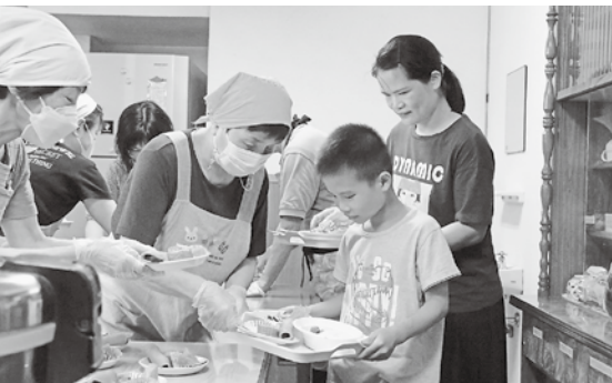
(上) コープデイズ豊岡が協力の「おむすびの会」の活動の中で、自由な新聞紙遊びの時間。自宅ではなかなか見られない光景では。(下) 基本的には、自分でおかずを受け取ってお盆を完成させる「こども食堂ハグモグ」。スタッフから受け取るたびに自然な交流が生まれます。