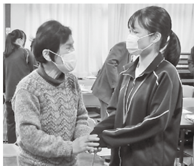
江原区 江原ふれあいサロン

(写真上) 一緒に体操する様子。「結構しんどい…！」と学生の皆さん。(中) ゲームを通じて、楽しみながらお互いを知りました。(下左・右) 最初は緊張交じりの交流も、回を重ねるごとに笑顔が増えていきました。