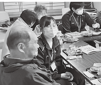
東構区 ふれあい喫茶だんだん