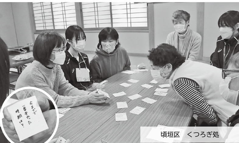
頃垣区 くつろぎ処