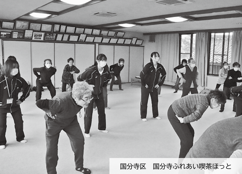
国分寺区 国分寺ふれあい喫茶ほっと