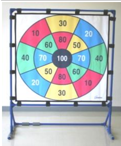
大型ターゲットゲーム（丸型）