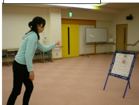
小型ターゲットゲーム