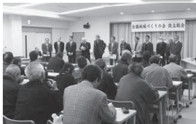
会員募集中！合橋地区在住・出身の方ならどなたでも 〔申し込み〕豊岡市役所 但東支所 TEL 54-1000