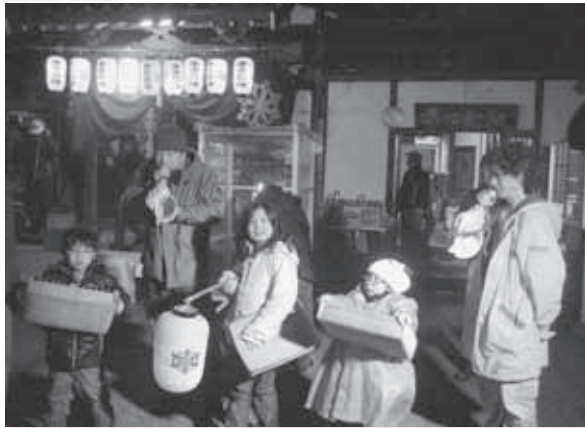
「厄はらいましょう」と子どもたちの声が響きます