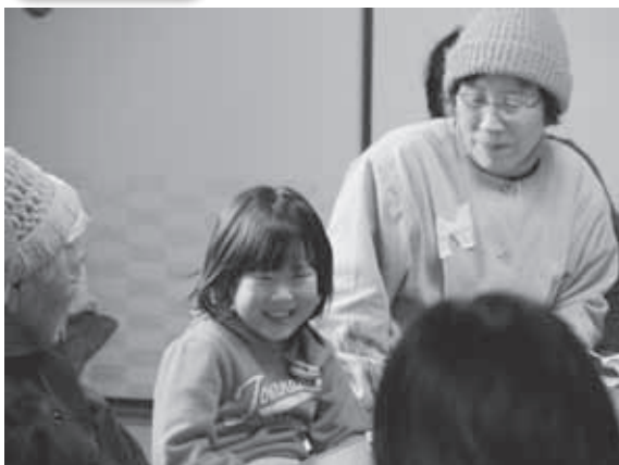
かわいい笑顔につつまれてほんわか