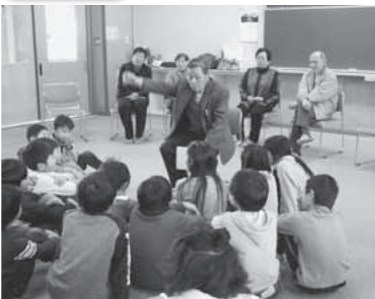
おじいちゃんの話に聞き入る子どもたち