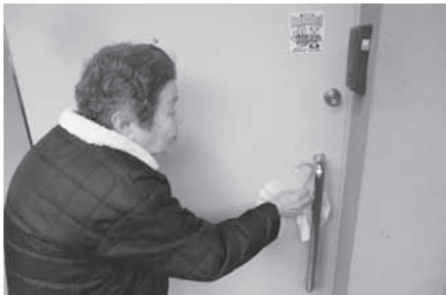
「今日も元気ですよ」と毎朝玄関にハンカチをかけます