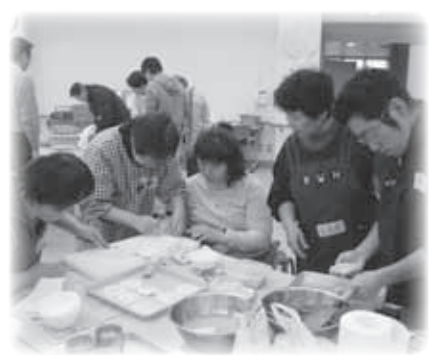
但東地域『ハートすまいる』お菓子づくりの好きな住民の方が特技を発揮！みなさんの笑顔であふれています。

社協では、地域のボランティアのみならず、障がいのあるなしに関わらず、地域でつながり合う場をつくっています。みんなでしたいことを相談しながら、ゲームや歌、お菓子づくり等のレクリエーションを楽しんでいます。活動を通じて友達づくり、地域のつながりづくりをすすめています。ぜひ一度のぞいてみてください。