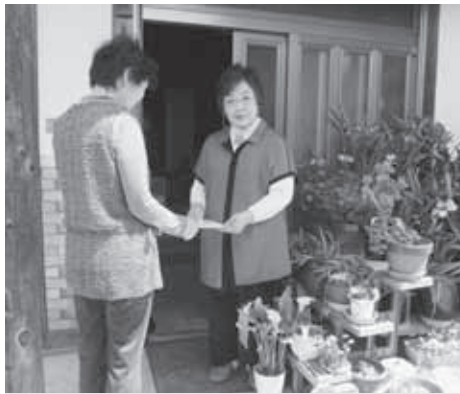
ささえあい通信を高齢者に手渡しし、 安否確認(グループさくら)

そのほか「電話で安否確認」「近所で見守る」「災害時には、要援護者をどう避難させるか」など様々な意見が出ました。参加者は、このような機会を度々開催することが意義のあることと確認しました。