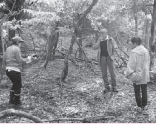
「この辺りに基地作れるかなあ」

自然のなかでともに楽しもう ぶなっこクラブのスタッフは、子どもたちにも但東町の美しい自然に親しみ、昔ながらの生活や遊びを伝える活動のお手伝いをしています。 今年も昨年の参加者の意見を参考に会議を重ね活動計画を作りました。そして、7月に行う「秘密基地をつくる」の活動に向けて、平田自然子ども村の下見に出かけました。「子どもたちが怪我をせずにおもいっきり遊べるようにしたい」という思いで確認や準備をすすめています。 スタッフは「子どもらと一緒に楽しみなから活動を手伝いたいなあ。スタッフも子どもらも増えて交流の輪を広げ、参加者で楽しめたらえーなあ」と話していました。 (次回開催案内は7ページに掲載)