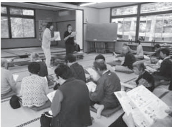
みなさん、真剣に聞き入っています

参加者は「おもしろくてわかりやすかった」「家でテレビを見ていてもつまらない。今日は勉強もできまし、みなさんとも話ができよかった」と話していました。