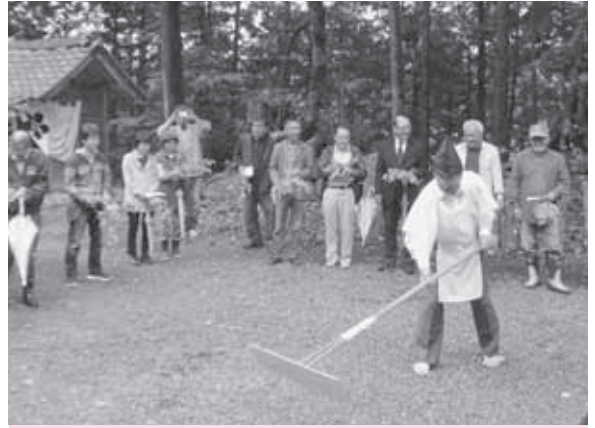
今年も豊作であることを願って

地域の方は「先人がずっとつなげていくことを、我々は後生にも伝え続け、守っていかなん」と話していました。