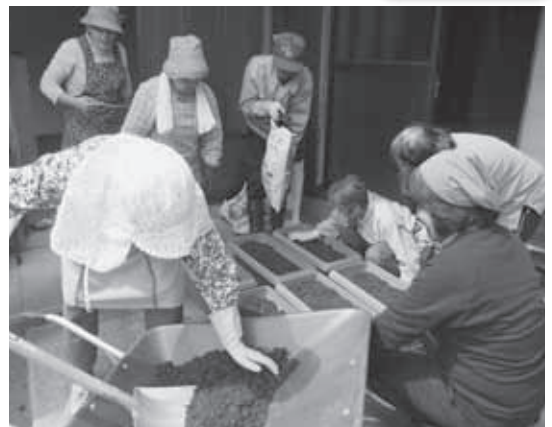
土づくりにも愛情たっぷりと込めました

参加した方は「ひまわりの成長を見守りながら、気楽に集うサロンも、永く続けていけるようにしたい」と話していました。