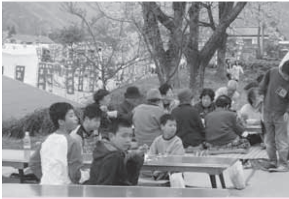
手づくりのお祭りは子どもたちの 良い思い出に

桜も笑顔も満開! 4月13日、野区にある耳地藏尊でお祭りが行われました。地区住民で構成された実行委員会が、住民交流の場になるようにと毎年企画・運営を行っており、今年で21年目を向かえました。 区の各団体が協力して、子どもから大人まで楽しめる店などを出し、満開の桜の下、おでんや焼き鳥など食べながら大人はお酒を酌み交わし、子どもたちは周りを楽しそうに走り回っていました。 実行委員会のメンバーは「世代を超えて集まり楽しませている」、来場者は「来る人は区民が多いし、お参りしたみんなで楽しむって、ええで!」と、孫や近所の友人に囲まれながら話していました。