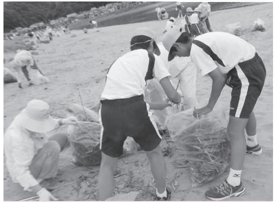
港中学校生徒会の始めた活動が、地域全体住民へと広がり続けています