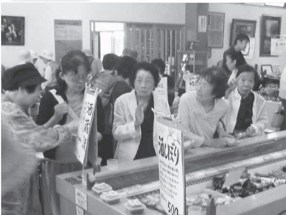
「いろんなもんがあるんだなあ」