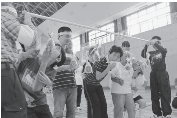
パンが生きてる!なかなかつかまえないぞ〜