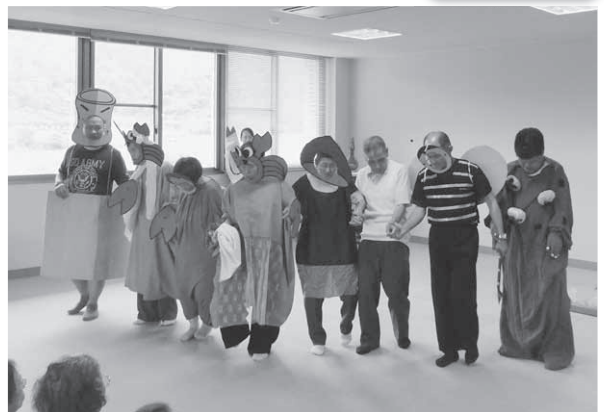
カーテンコールに応えて勢揃い♪