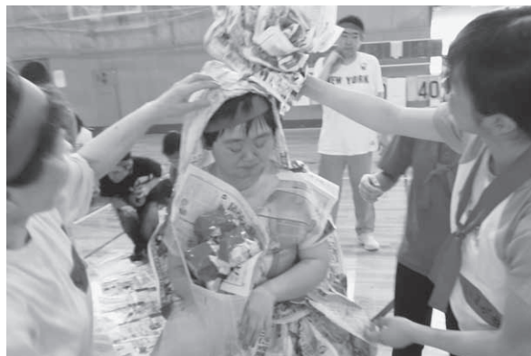
キレイな衣装にしてね

7月5日(土)、豊岡市総合体育館で市内の障がい者(児)を対象に、「なかよしゲーム・スポーツ大会」を開催しました。