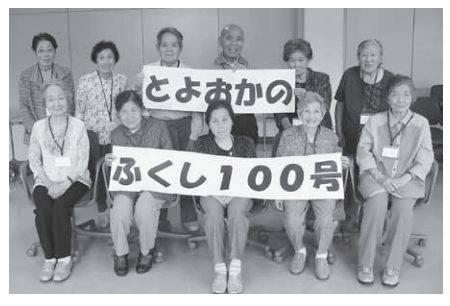
日高まじろ俱樂部のみなさん

2006年4月25日より毎月発行している広報紙『とよおかのふくし』が創刊100号を迎えました。地域の福祉情報を掲載し、みなさまに親しまれる広報紙を目指してまいりますので、これからもよろしくお願ひいたします。