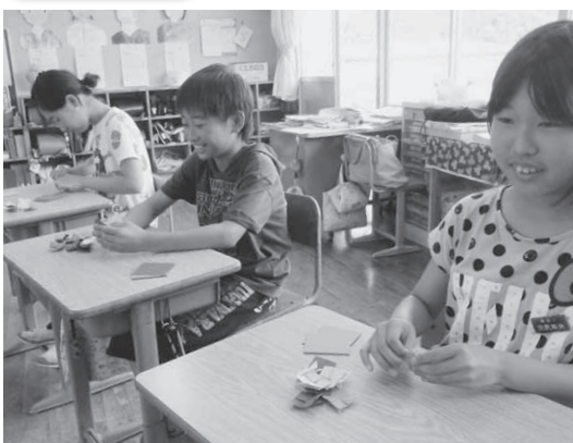
「たくさん咲かせたいなあ」「奥赤の人たちにも喜んでもらいたいね」と思いを込めて