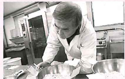
特産品づくりの研究