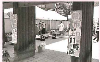
城崎駅通り公園で朝市を開催

城崎内川地区の有志のグループ「KAKEHASHI」やコミュニティ城崎の「まちのつながり部」などで活動し、収穫祭や朝市を開催するなど、地域づくりに取り組んでおられます。