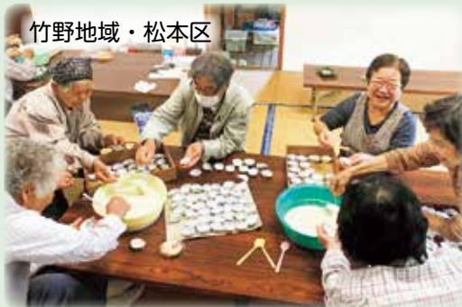
竹野地域・松本区