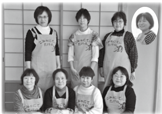
やませみスタッフの皆さん

自分の心が豊かになる、自分の知らないことを学ぶ、自分が楽しむ…。3名に共通する『ボランティア活動を行う理由』のひとつが「自分自身のため」だということ。ボランティア活動を迷っている方へのひと言を伺うと、「ご自身のために最初の一步を踏み出す勇氣を持ってもらいたい」と口を揃えて答えました。「地域に貢献することも、仲間がいれば楽しみながら頑張れると思います。」「飛び込んだら、いろんな方との出会いが待って