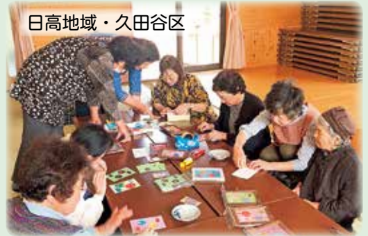
日高地域・久田谷区