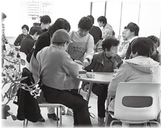
毎回あちらこちらで会話が花が咲き、スタッフも交流の輪に入ります。