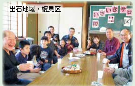
出石地域・榎見区