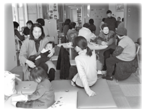
「たくさん人がいて、心が温まるなあ～」 と毎月の地域交流を楽しみにしている方 も。