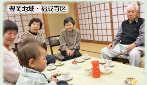
豊岡地域・福成寺区