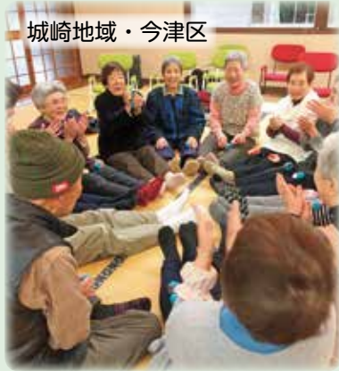
城崎地域・今津区