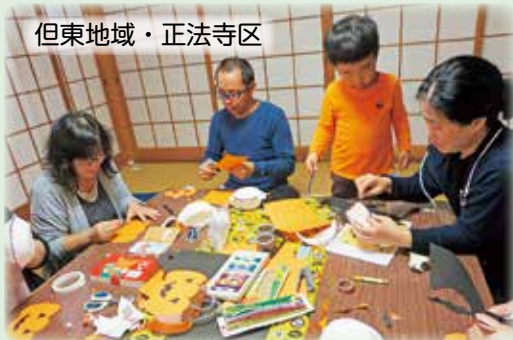
但東地域・正法寺区