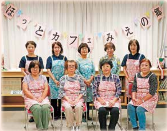
7月のカフェの様子

三江コミュニティ主催「ほっとカフェみえの郷」が、7月21日にオープンしました。地域ボランティア11名が中心スタッフとなり、月に1回開催されます。6月（プレオープン）と7月は延べ65人の参加者があり、あちらこちらでお喋りの輪が広がりましたが、新型コロナウイルスの影響で8・9月は開催中止。地域からは「今月はないんか」「残念だけど仕方ないなあ」と惜しむ声がありました。