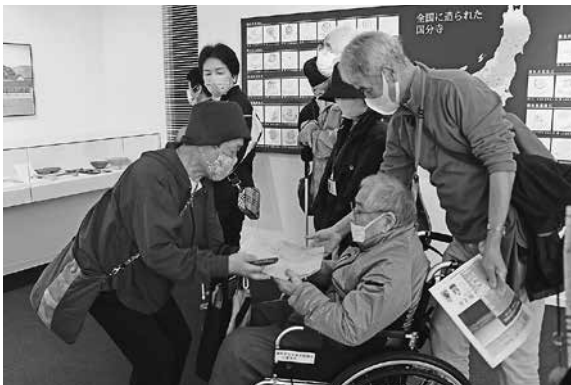
(左上・右上) 参加者にそとよりそい、視覚的な説明を混ぜながら、ともに但馬の歴史を学びました。(下) 触感や重みを感じてもらえるよう、但馬国分寺の瓦を参加者に回すメンバー。