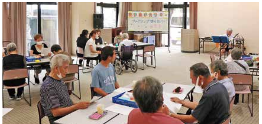
素敵な演奏に思いを乗せて。みんなの願い、叶いますように！ (「あいあいカフェ」でフォークソングコンサートと七夕飾りづくり)