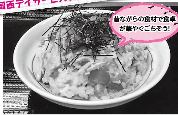
昔ながらの食材で食卓が華やぐごちそう!