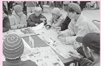
二木会でクリスマス会のボランティア

二木会、こころ豊かな人づくり500人委員、子育て支援、サロンのお世話など、様々なボランティアをされています。人や地域のつながりは宝と考え、みんなで一緒に楽しみながら取り組むことを大切にされています。