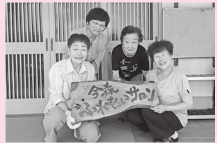
サロンもみんなで楽しみながら行います

Q 最初のきっかけは何ですか？ A 「何もしていないのはお母さんだけだなあ」。40年前、子どもは学校で勉強を、主人も資格取得のため勉強をしていたので、私だけ勉強をしていないと何気ない会話で言われました。そんなことがあり、数ヶ月後、たまたま話奉仕員養成講座の募集を見つけ、受けることにしました。そこから手話を活かしたボランティアが始まりました。